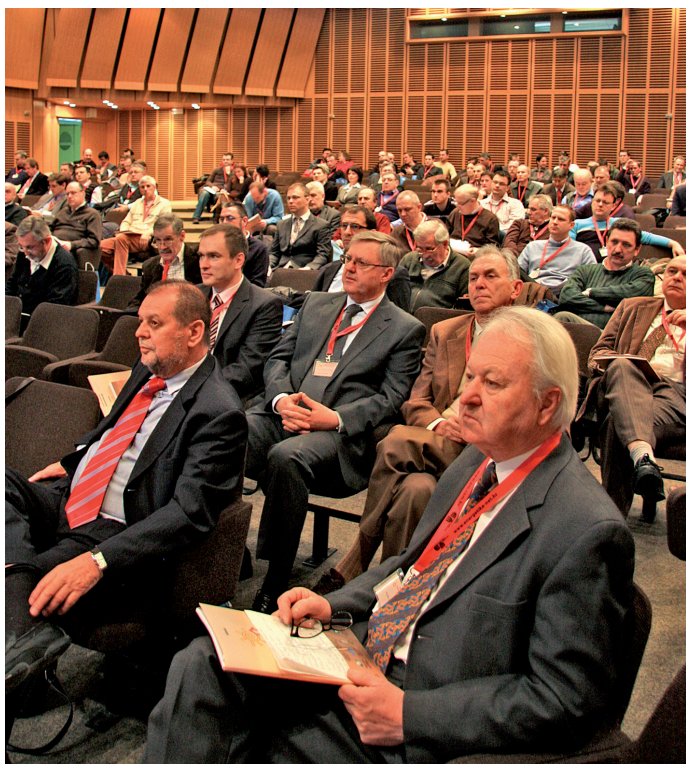
Seminar je okupio brojne stručnjake

U velikoj kino-dvorani Ministarstva gospodarstva, rada i poduzetništva je 25. veljače ove godine održan seminar 'Mogućnosti primjene solarnih toplinskih sustava' koji je okupio oko 180 sudionika. Osim brojnih zanimljivih izlaganja, vrijedi spomenuti i da je na Seminaru predstavljena i nova knjiga iz EM-literature pod naslovom 'Osnove primjene solarnih toplinskih sustava'.