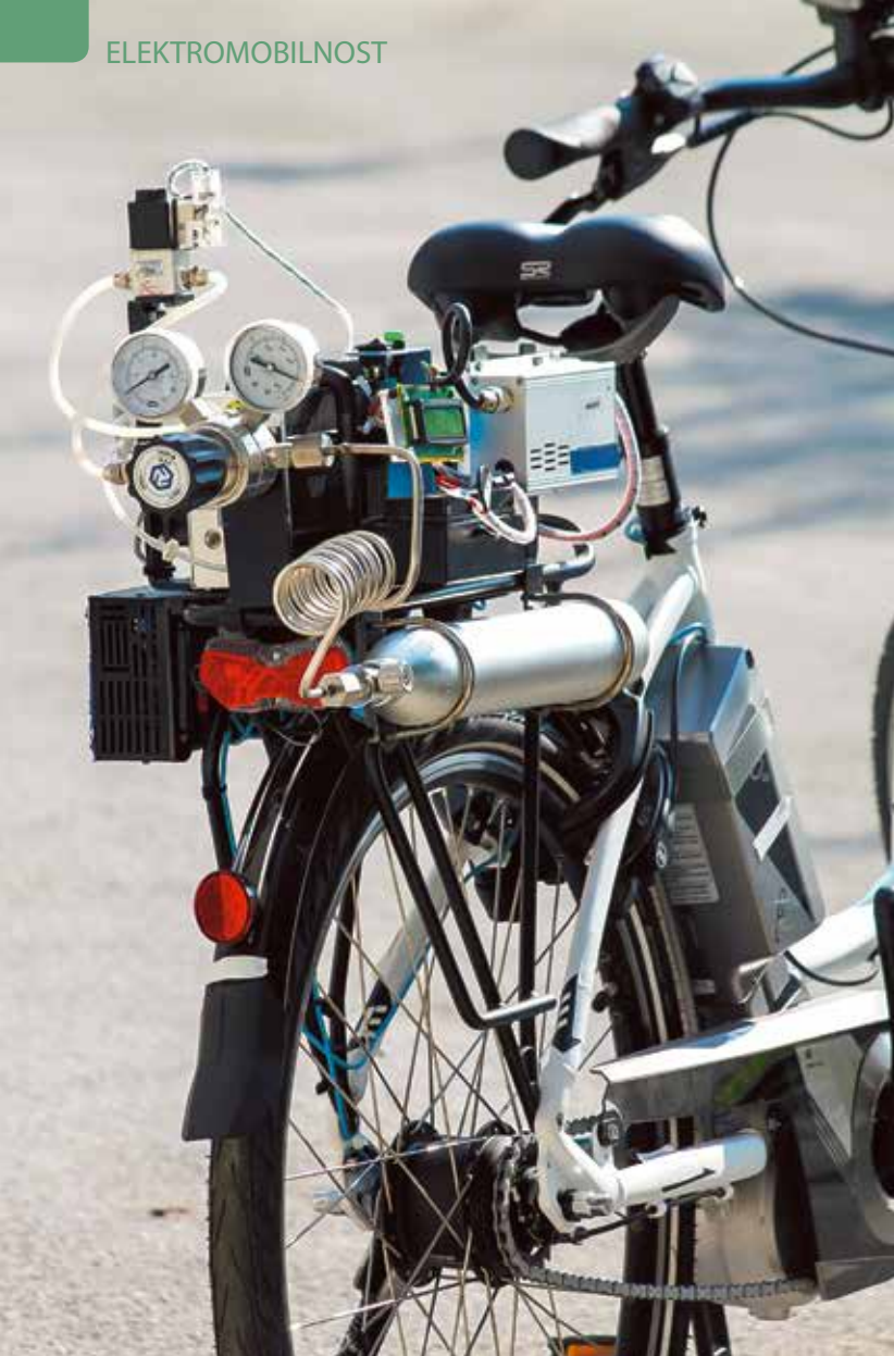
Pogled izbliza na sustav gorivnih članaka na nosaču za prtljagu i njegovi sastavni dijelovi...