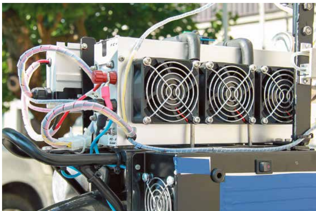
... sklop gorivnih članaka s ventilatorima za odvođenje nastale topline (središnji dio cijelog sustava)

Ukupna masa bicikla iznosi nešto više od 30 kg, što znači da masa sustava gorivnih članaka iznosi oko 7 kg.