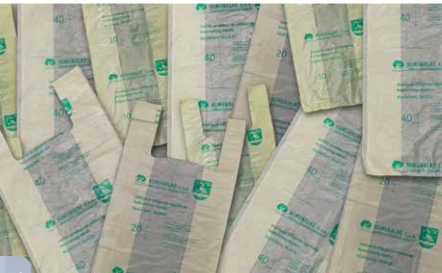
▲ Vrećice za miješani otpad u Slavonskom Brodu

Z akonom o gospodarenju otpadom propisana je obveza odvojenog sakupljanja komunalnog otpada na 'kućnom pragu'. Stoga su smanjenje njegovih količina, i povećanje odvojeno prikupljenog otpada imperativ današnjice. S njime su susreću gradovi, općine i njihovi stanovnici, zazivajući pritom što pravednije i džepu prihvatljivije načine obračunavanja s otpadom.