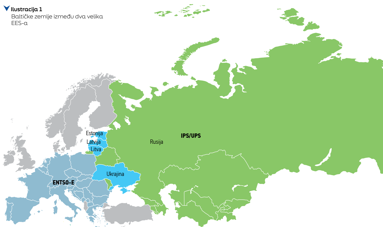
▼ Ilustracija 1 Baltičke zemlje između dva velika EES-a

Nakon invazije na Ukrajinu, odvajanje Estonije, Litve i Latvije od Integriranog elektroenergetskog sustava - Ujedinjenog elek-